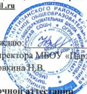
График проведения промежуточной аттестации учащихся 5-х классов 2023-2024 учебный год