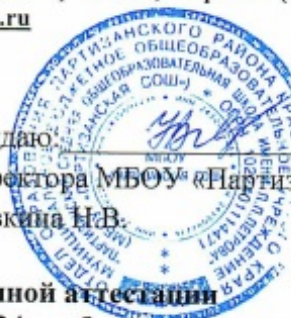
График проведения промежуточной аттестации учащихся 10-х классов 2023-2024 учебный год