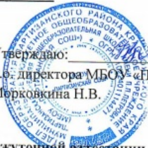
График проведения промежуточной аттестации учащихся 6-х классов 2023-2024 учебный год