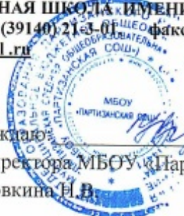
График проведения итоговой аттестации учащихся 11 класса 2023-2024 учебный год